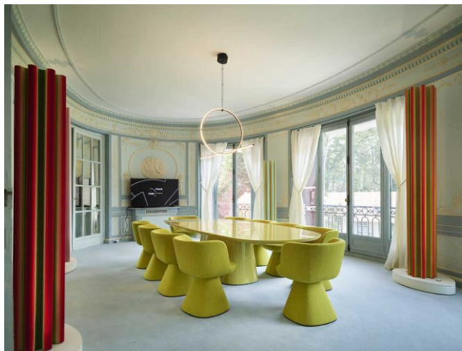
La stanza ovale della sala riunioni, con il tavolo 'Allure O' e le poltroncine 'Flair O' di Monica Armani per B&B Italia. Le colonne colorate composte di fili di lana sono l'opera 'Il Giardino perduto' di Matteo Nasini.

Elemento di coesione del lungo itinerario artistico è la luce, curata da Fabertecnica di Marco Frascarolo.