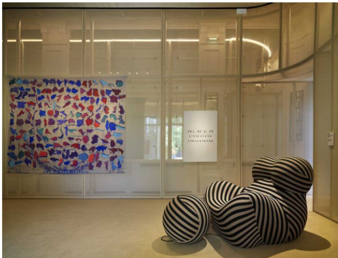
Sempre nella Galleria, le opere di Julie Polidoro 'Tutti i Paesi Grandi Uguali', 'Tra me e te l'infinito inesistente' dell'artista concettuale Vincenzo Agnetti e la poltrona 'Up' di Gaetano Pesce.

Segue l'area lounge con il bar (design di interni di Atelier Bianca Elena Patroni Griffi ), caratterizzata da una lunga vetrata perimetrale che separa l'interno dal giardino, e la sala Milano-Cortina 2026 .