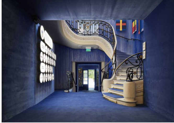
La scala che conduce al piano superiore.

Elemento di coesione del lungo itinerario artistico è la luce, curata da Fabertecnica di Marco Frascarolo.