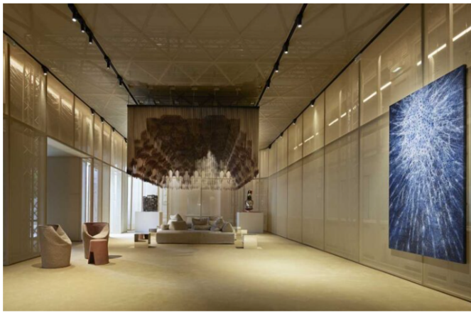
Tessuti Rubelli semitrasparenti per l'ingresso della Galleria. Sopra il divano Sherazade di Francesco Binfarè per Edra, l'opera il Tappeto Volante realizzata dal collettivo Stalker, insieme alla comunità curda esule a Roma, un gruppo di architetti attivisti, in cui 41.472 corde di canapa con terminali di rame riproducono le muqarnas del soffitto della Cappella Palatina di Palermo.